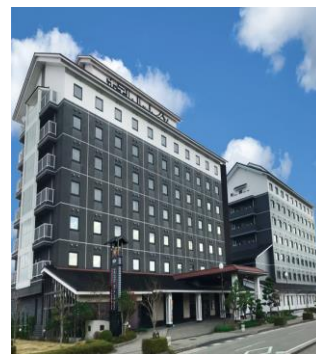
ホテルルートイン輪島