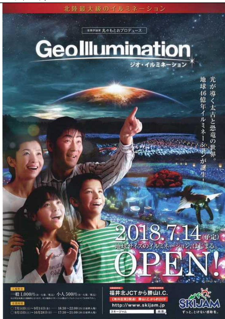
ジオイルミネーション