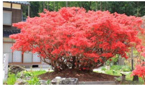
芦田家の満開(イメージ)