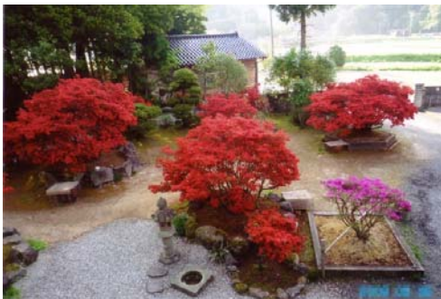
櫻井家の満開の様子(イメージ)