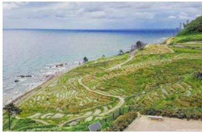
白米千枚田(イメージ)