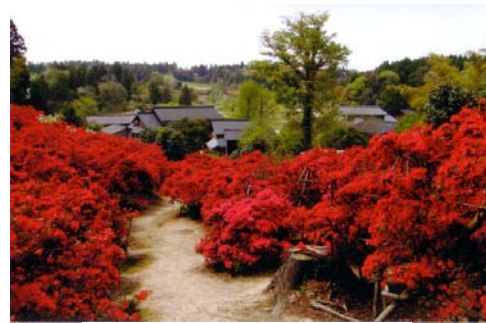
前家の満開の様子(イメージ)

===道の駅なごみ===万年寺庭園===穴水『明楽寺』===道の駅中島ロマンの里===